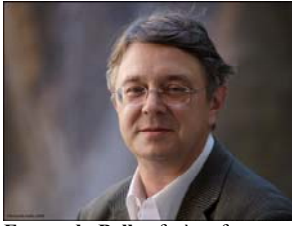
Fernando Bellas fotogràf